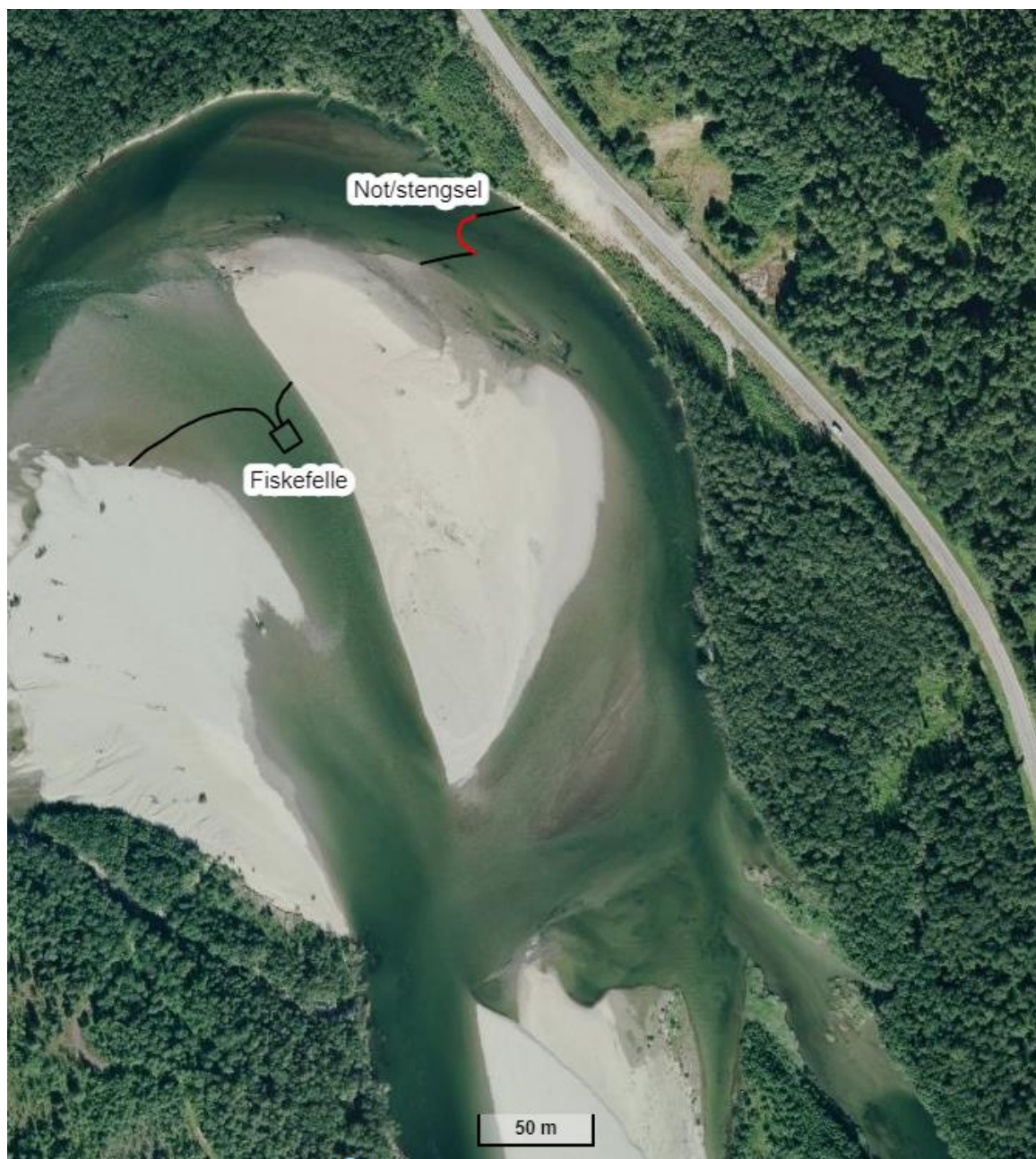
Figur 3: Flyfoto over Reisaelva der fiskefellen og sperregjerdet ble satt ut ved Styggøya. Fellen ble forsøkt satt ut helt nederst i bilde, men dette ble problematisk pga. vanskeligheter med å få ned gjerdestaur.