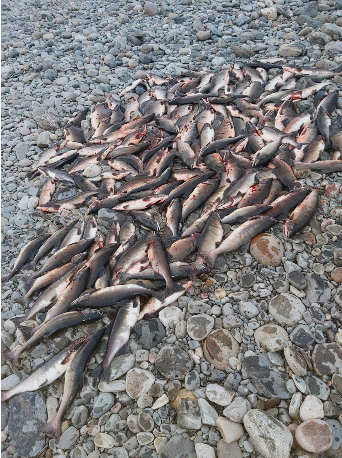
Bilde 1: Resultat av ett garntrekk ved Galsomelen.