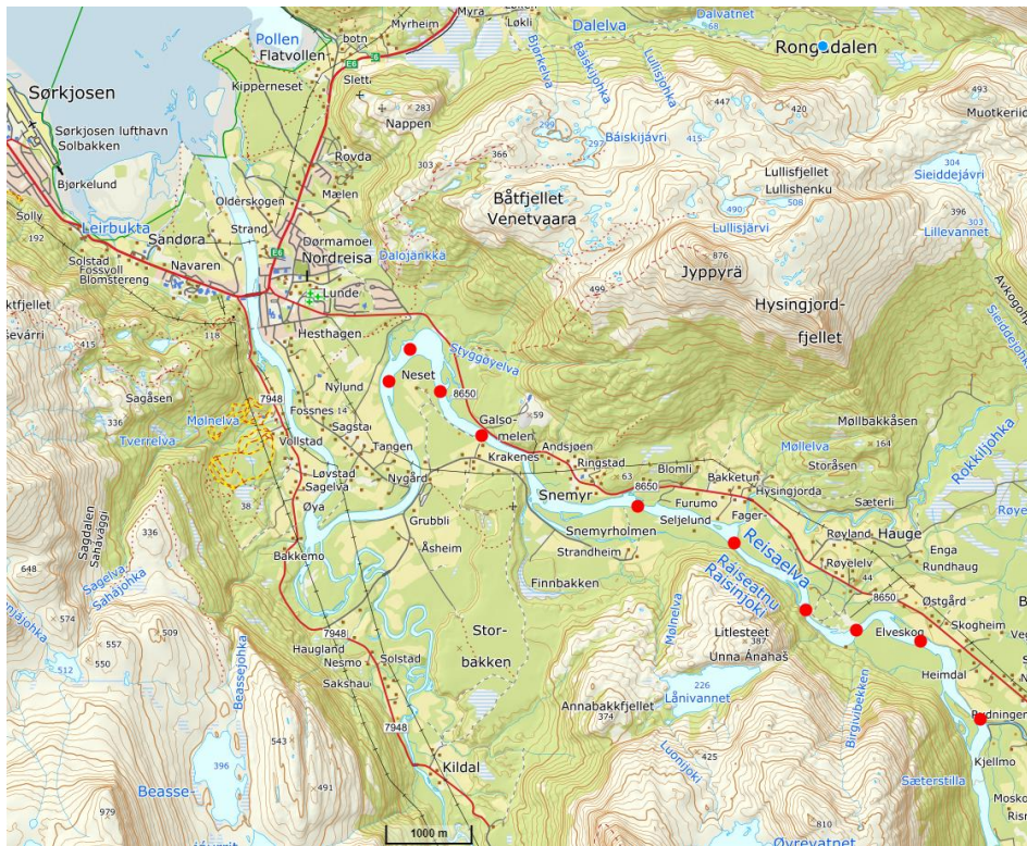
Figur 1: Oversikt over lokaliteter (markert i røde punkter) for utfisking med garn i nedre del av Reisaelva, fra nedre del av Styggøya til Moskoelvmunningen. Det er observert pukkellaks også lengre opp, men med unntak av noen få lokasjoner i øvre del er det ikke gjennomført utfisking. Se figur 2 for oversikt i øverste del.