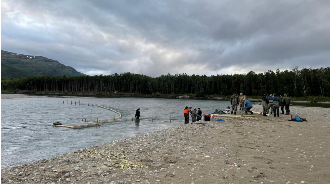
Bilde 3: Fiskefelle med ledegjerde ved Styggøya.