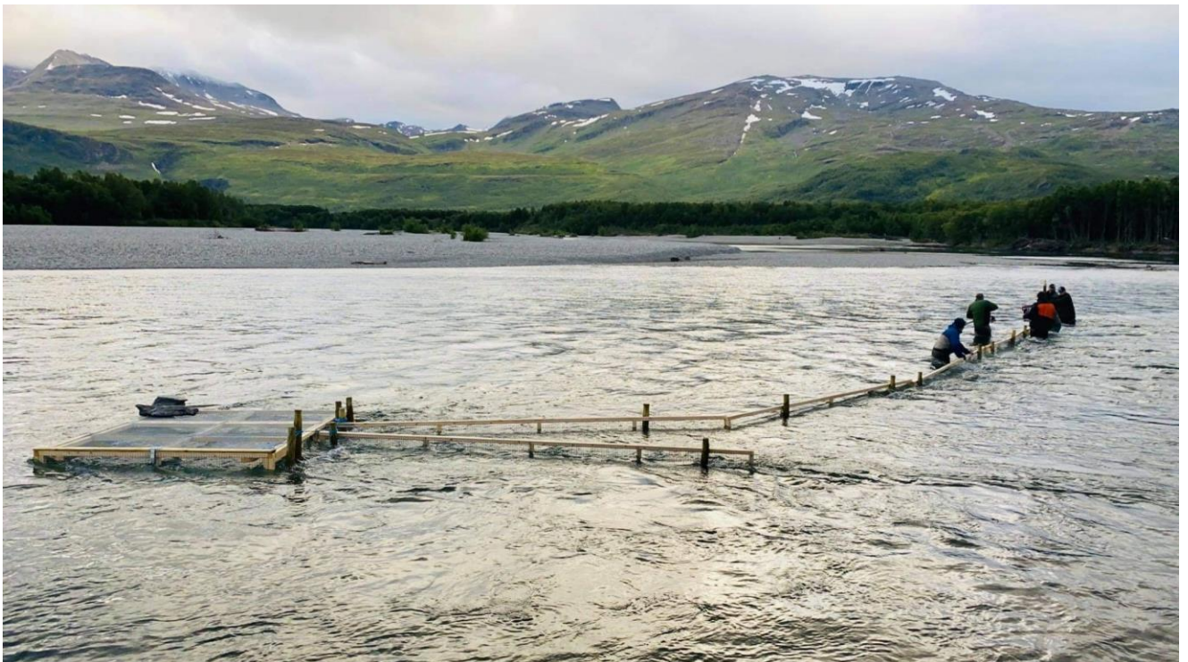
Bilde 4: Fiskefellen utplassert. Bygging av ledegjerder.