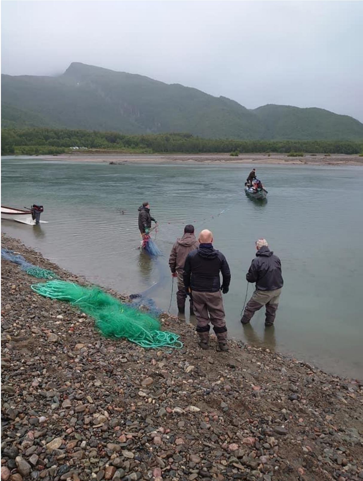
Bilde 2: Klargjøring av drivgarn.