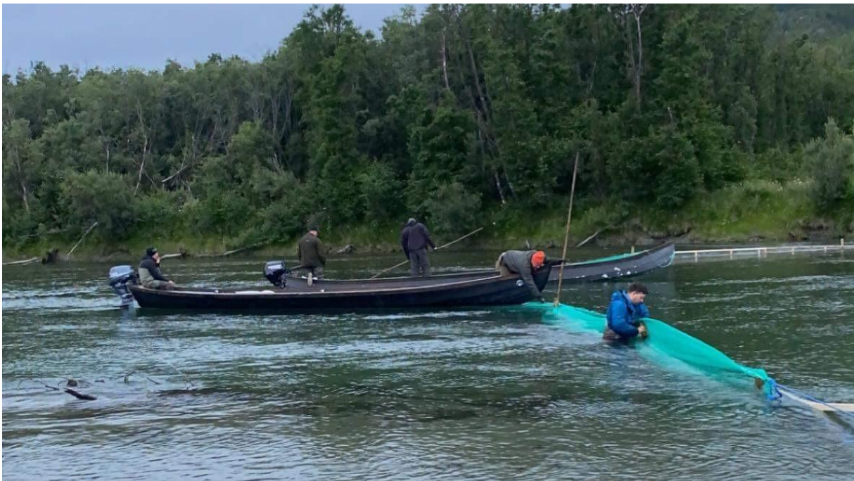
Bilde 6: Montering av not for å sperre av dypeste del av elveløpet.