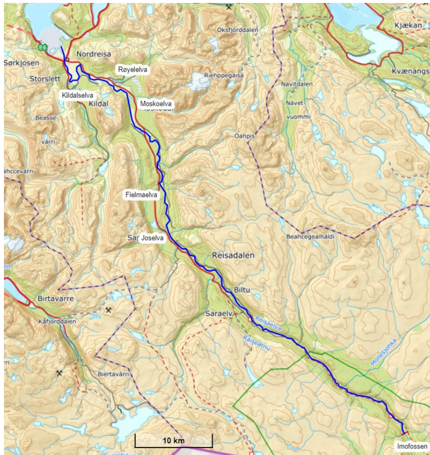
Figur 1: Lakseførende strekning i Reisavassdraget med stopp ved Imofossen. Noen viktige sideelver markert inn (norgeskart.no).