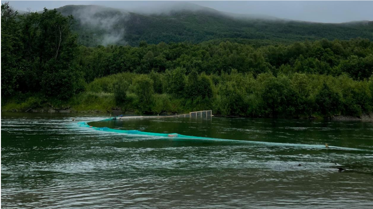
Bilde 5: Sperregjerde og not for å sperre av elveløpet. Fiskefellen er satt i det andre elveløpet.